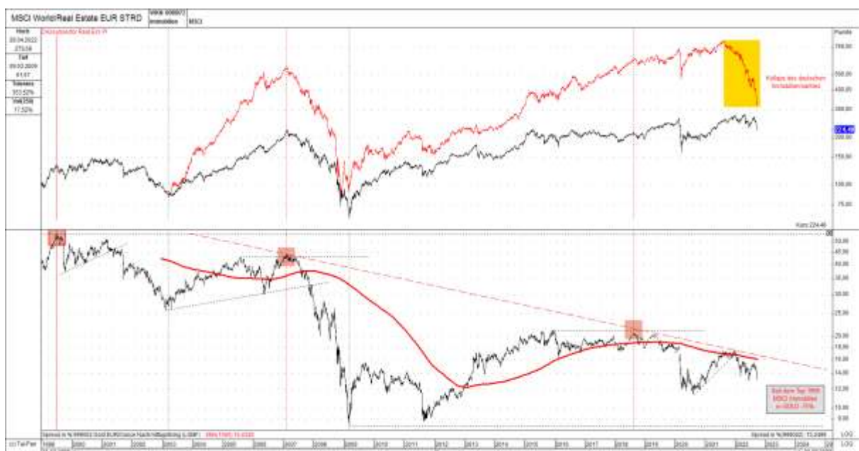
Abb. 3: MSCI World Real Estate-Index in EUR (oben schwarz) und DAX Immobilien-Index in EUR (oben rot) versus MSCI World Real Estate-Index in GOLD (unten) von 12/98 bis 09/22

Was im Immobiliensektor aktuell besonders auffällt, ist die extreme Schwäche des deutschen gegenüber dem internationalen Immobilienmarkt (siehe hierzu rote Linie im oberen Teil von Abbildung 3). Während sich der MSCI World Immo noch relativ stabil zeigt, kollabierte im Gegensatz hierzu der DAX Immobilien in den vergangenen 12 Monaten förmlich! Neben den extremen ökonomischen und geopolitischen Problemen könnte besonders in Deutschland, mit seiner Inflations- und Währungsreformhistorie (Reichsmark, Rentenmark, Reichsmark, Deutsche Mark und Euro), auch die Änderung und Ausweitung des Artikel 21 im Lastenausgleichsgesetz eine Rolle spielen (siehe hierzu Punkt 4 im folgenden Artikel: „Wie verhindern Immobilieneigentümer eine Teil-Enteignung ihrer Vermögenswerte?“ )