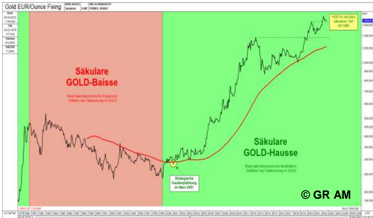
Abb. 7: Goldpreis in EUR/Unze (vor 1999 ECU) auf Monatsschlusskursbasis von 12/1978 bis 09/2022