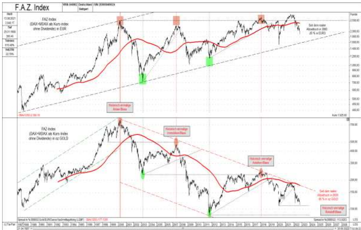
Abb. 1: FAZ-Index in EUR (oben) versus FAZ-Index in GOLD (unten) von 04/87 bis 09/22

Obwohl er sich nominal (in EUR bewertet) seitdem nur seitwärts bewegt, verlor er real (in Unzen Gold bewertet) - während eines stufenweise abwärts gerichteten Prozesses - über 80 (!) Prozent. Die zwischenzeitlichen Erholungen ("Hochdruckgebiete im ökonomischen Winter") erreichten immer nur das vorherige taktische Tief. Im Januar 2018 ging nun die letzte Erholung zu Ende und wir befinden uns seitdem wieder im realen strategischen Kontraktionsprozess. Da es sich hierbei um das Finale der, nun mehr fast 20 Jahre andauernden, Krise ("ökonomischer Winter") handelt, wird der Aktienmarkt und somit auch die Wirtschaft real (nur sichtbar in Unzen GOLD) noch in schwere Schieflage geraten. Diese sich anbahnende Depression wird sich natürlich nicht nur negativ auf den Aktien-, sondern auch negativ auf den Immobilien- und den Anleihemarkt auswirken. Nominal können alle drei Anlageklassen durchaus noch deutlich höher steigen (siehe hierzu Beispiele von Hyperinflationen), jedoch real, in Unzen Gold bewertet, werden alle drei in den kommenden Jahren förmlich kollabieren..."