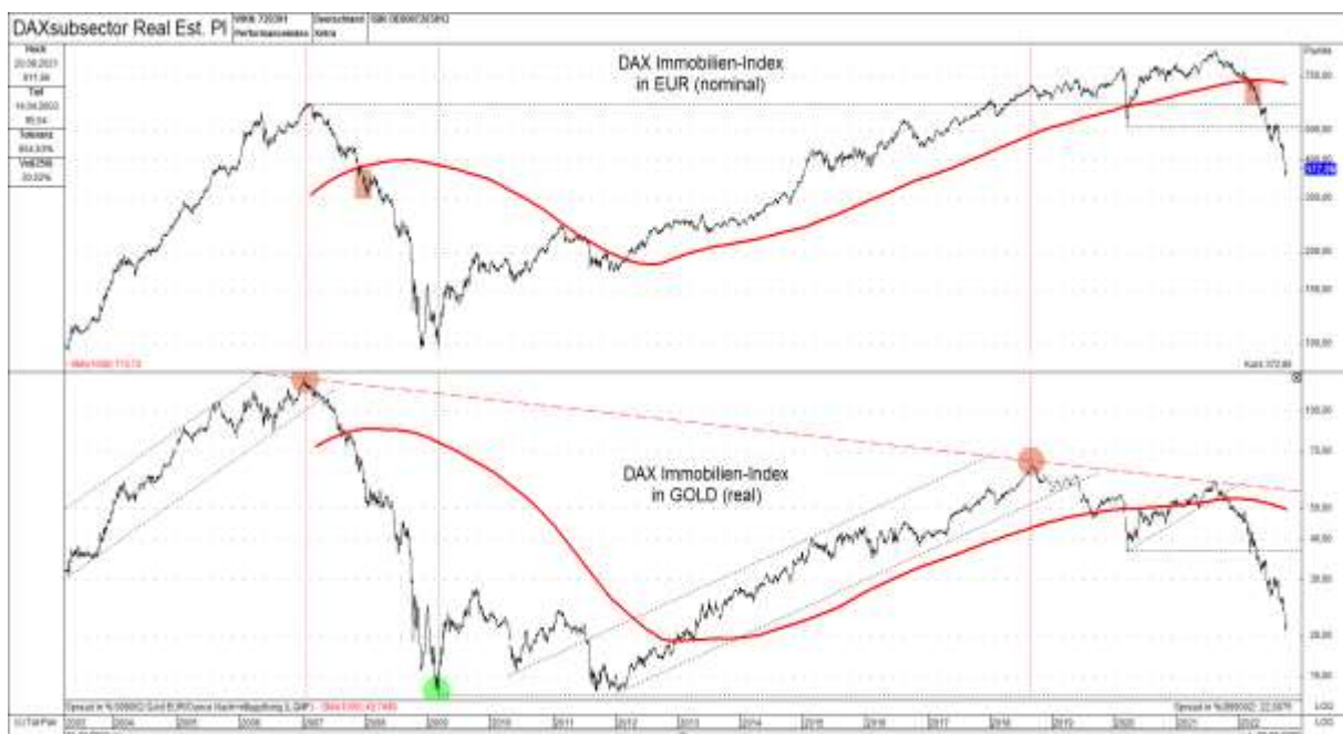
Abb. 2: DAX Immobilien-Index in EUR (oben) versus in GOLD (unten) von 03/03 bis 09/22

Was im Immobiliensektor aktuell besonders auffällt, ist die extreme Schwäche des deutschen gegenüber dem internationalen Immobilienmarkt (siehe hierzu rote Linie im oberen Teil von Abbildung 3). Während sich der MSCI World Immo noch relativ stabil zeigt, kollabierte im Gegensatz hierzu der DAX Immobilien in den vergangenen 12 Monaten förmlich! Neben den extremen ökonomischen und geopolitischen Problemen könnte besonders in Deutschland, mit seiner Inflations- und Währungsreformhistorie (Reichsmark, Rentenmark, Reichsmark, Deutsche Mark und Euro), auch die Änderung und Ausweitung des Artikel 21 im Lastenausgleichsgesetz eine Rolle spielen (siehe hierzu Punkt 4 im folgenden Artikel: „Wie verhindern Immobilieneigentümer eine Teil-Enteignung ihrer Vermögenswerte?“ )