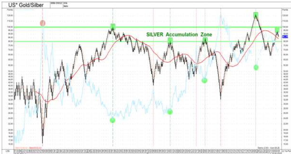
Abb. 5: Gold-Silber-Ratio (Renko-Chart) versus Silber in USD (blau) von 02/1973 bis 09/2022

Während der Renko-Chart (visuelle Volatilitätsreduktion) des Gold-Silber-Ratios im September ein klares Verkaufssignal (reziprok Kaufsignal beim Silber-Gold-Ratio) generierte (siehe hierzu Abbildung 5), entwickelt sich beim Silber-Gold-Junior-Mining-Ratio seit Monaten eine positive Divergenz, was für eine aufkommende relative Stärke des Silbersektors und somit neu beginnende Hausse im gesamten Edelmetallsektor spricht! Silber visualisiert immer den „Hebel auf Gold“, sowohl positiv als auch negativ (siehe hierzu Abbildung 6)!