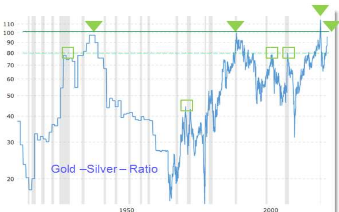
Abb. 4: Gold-Silber-Ratio (Monatsschlusskursbasis) von 02/2015 bis 08/2022