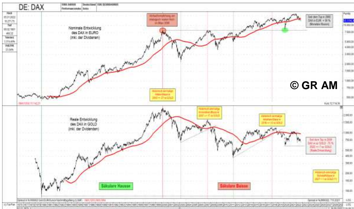
Abb. 8: DAX in EUR (oben) versus DAX in Unzen GOLD (unten) von 01/1976 bis 09/2022

„Der Standardschutz gegen das Desaster in der Geschichte ist immer nur Gold gewesen. Gold in jeder Form, die ihr Land Ihnen erlaubt: als Barren, Münzen oder Aktien.“