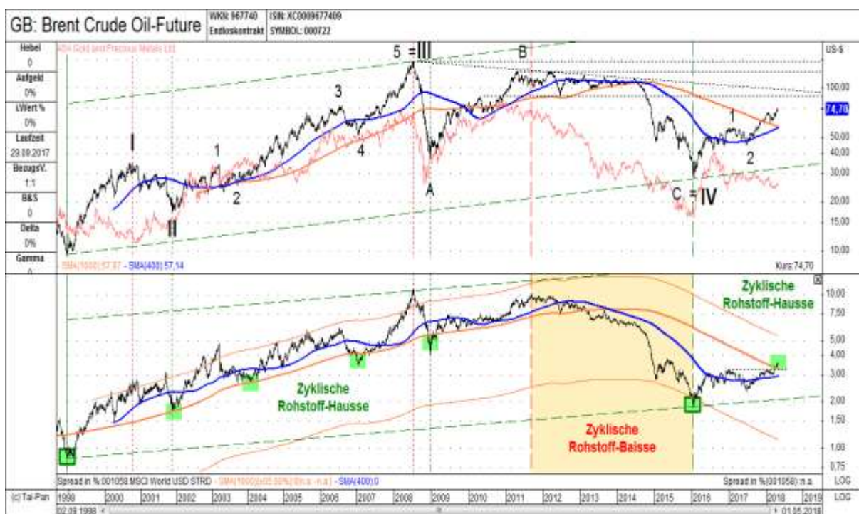
Abb. 1: Rohölpreis in USD (oben) vs. Rohölpreis-Weltaktien-Ratio (unten) von 09/1998 bis 04/2018

Wie sieht es nun, nach über zwei Jahren, aktuell beim Rohölpreis aus. Der Brent Crude Oil Future (Nordseeöl) stieg von seinem zyklischen Tief bei zirka 28 USD im Januar 2016 bis auf aktuell 75 USD im April 2018 (siehe hierzu den oberen Teil in Abbildung 1). Somit hat sich das Rohöl in nur 28 Monaten knapp verdreifacht, ohne dass dies vom Publikum groß wahrgenommen worden wäre. Die Preistransformation von den Vermögenswerten („Asset Price Inflation“) über die Erzeuger- in die Konsumentenpreise und somit das Sichtbarwerden der Inflation erfolgt mit einer gewissen Zeitverzögerung, weshalb in den kommenden Monaten mit offiziell steigenden „Inflationszahlen“ gerechnet werden muss. Wie in den vergangenen 20 Jahren zuvor, wird auch zukünftig der Edelmetallsektor dem Rohöl als „Inflationsseismograph“ folgen (siehe hierzu die Entwicklung der Gold- & Silberaktien als roten Kursverlauf im oberen Teil in Abbildung 1).