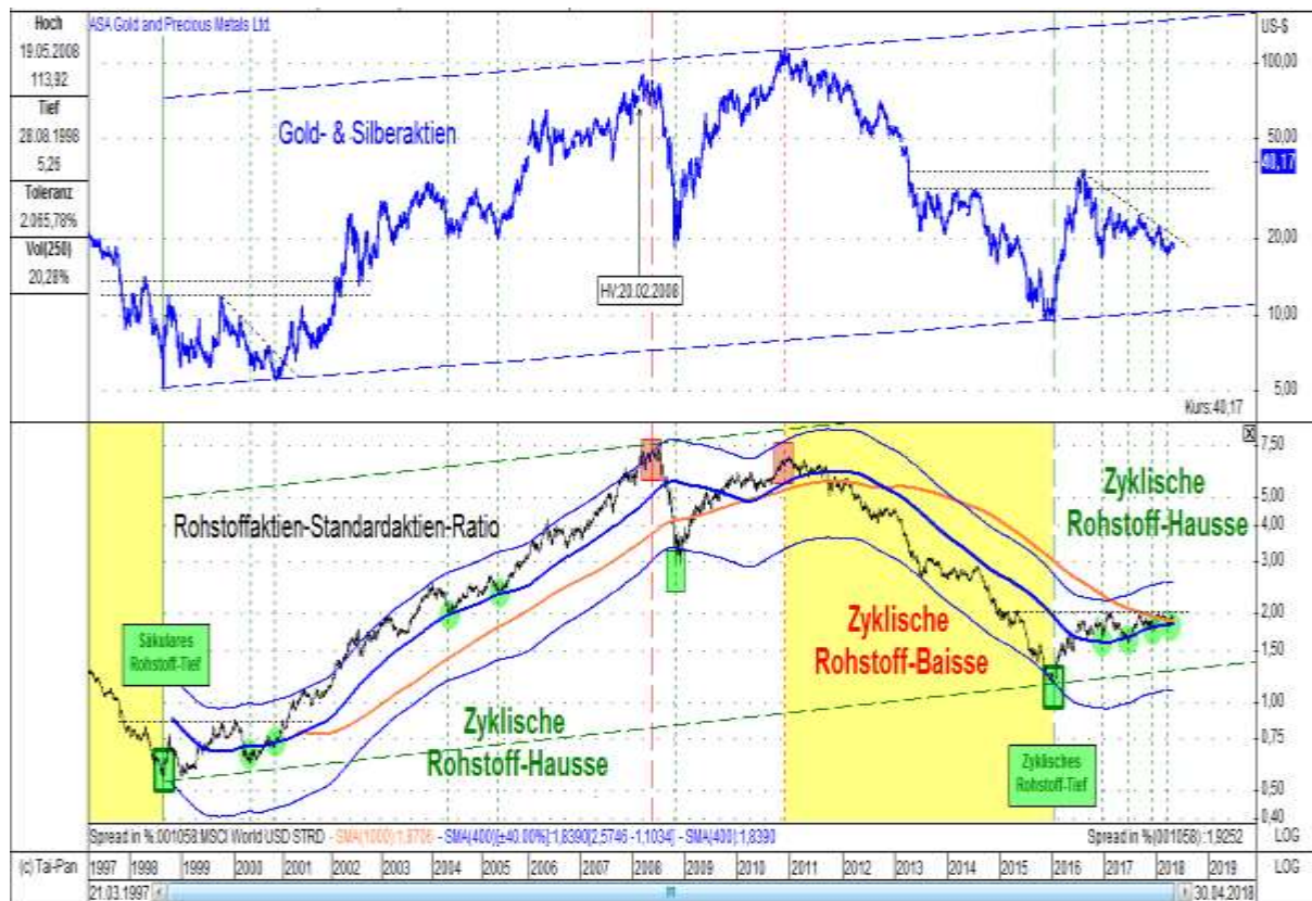
Abb. 2: Edelmetallaktien (oben) vs. Rohstoffaktien-Weltaktien-Ratio (unten) von 03/1997 bis 04/2018

Da wir uns seit der Aufhebung des Gold-Dollar-Standards am 15. August 1971 in einer strukturellen Dauerinflation befinden, kommt es nicht mehr, wie zuletzt Anfang der 1930er Jahre, bei Rezessionen (Depressionen) zu einer sichtbaren Deflation (Preisverfall auf breiter Front), sondern immer zu einer sogenannten „Stagflation“. Dieser Begriff wurde in den 1970er Jahren kreiert, da, aufgrund der mangelnden Golddeckung plötzlich – entgegen der historischen Lehrmeinung – die Preise trotz Rezessionen stiegen. Während die US-Aktienmärkte und die US-Wirtschaft damals, von 1966 bis Anfang 1980, über ein Jahrzehnt in USD bewertet volatil seitwärts liefen (monetäre Illusion), kollabierten beide gleichzeitig um zirka 90 Prozent, wenn man sie in Unzen GOLD bewertet hätte (reale Entwicklung). Während in den 1930er Jahren die Aktienmärkte, bei einer goldgedeckten Währung, in USD zirka um 90 Prozent einbrachen, sie in den 1970er Jahren, aufgrund der aufgehobenen Golddeckung, in USD seitwärts liefen, steigen sie nun im aktuellen ökonomischen Winter, welcher zum Jahrtausendwechsel begann, aufgrund der historisch einmaligen Zentralbankeingriffe durch ZIRP, NIRP und QE sogar in USD an. In Unzen GOLD bewertet liegt der MSCI Weltaktien-Index seit seinem historischen Hoch im Jahr 2000 aktuell um zirka 70 Prozent im Minus (siehe hierzu den Weltaktien-Index auf der drittletzten Seite dieses Kommentars).